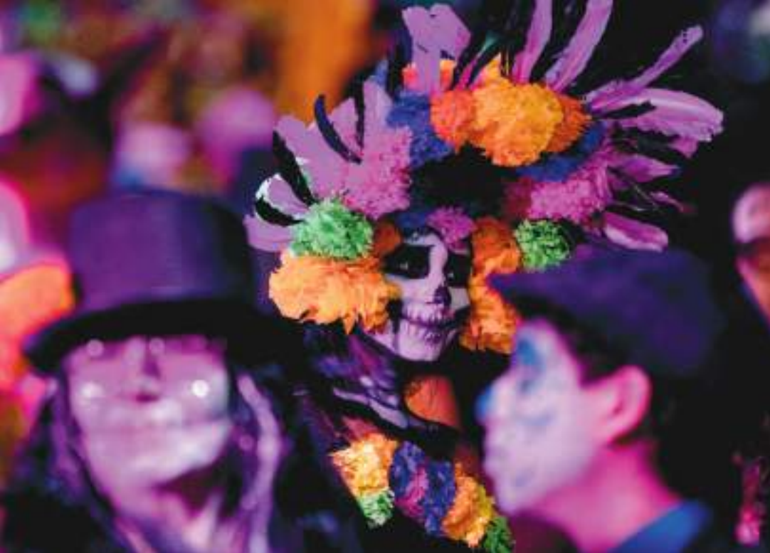
Entre el 29 de octubre y el 2 de noviembre, las noches se llenaron de color.