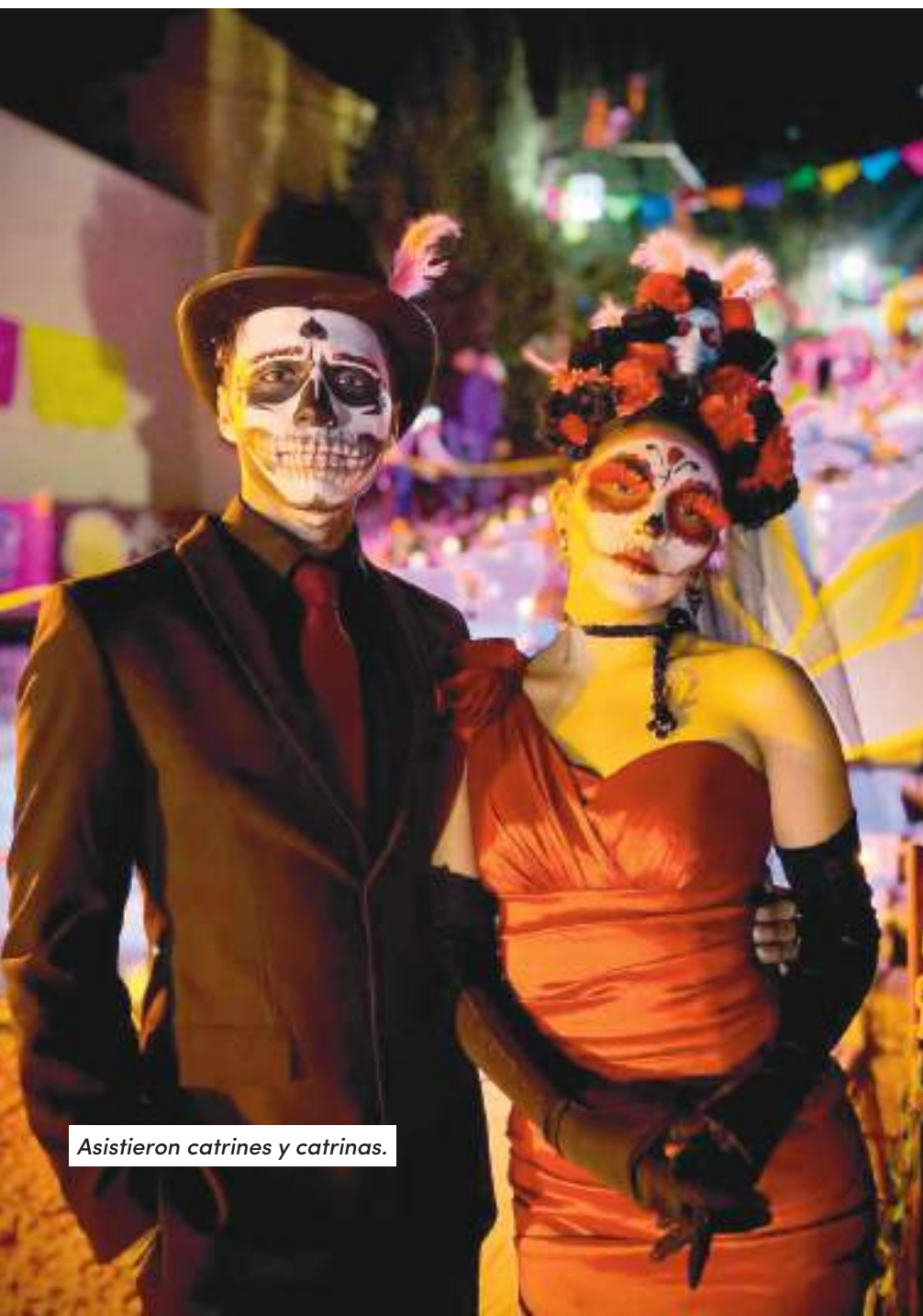
Asistieron catrines y catrinas.