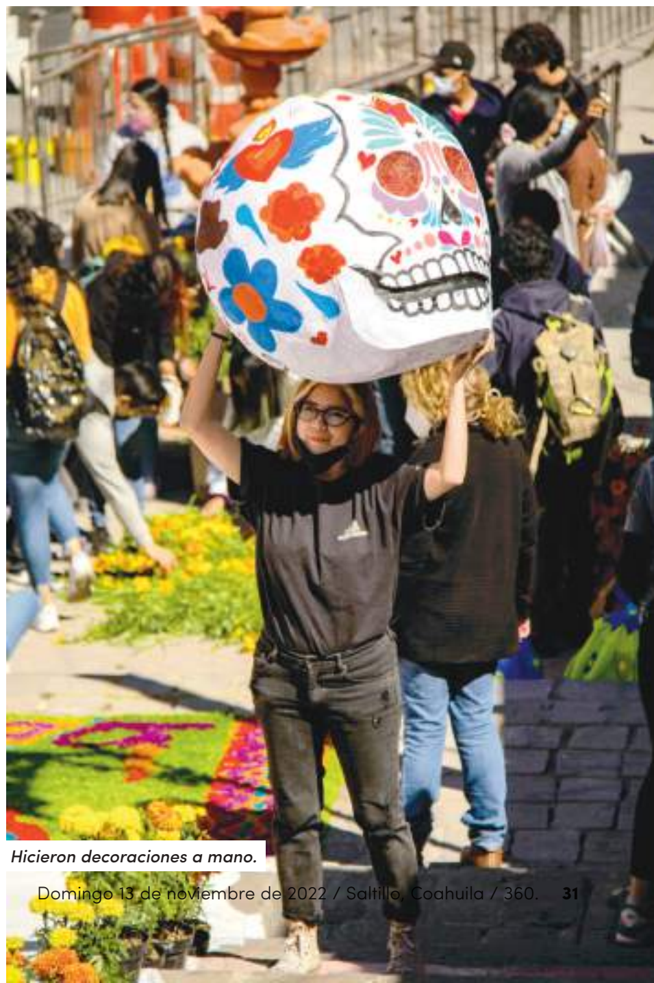
Hicieron decoraciones a mano.