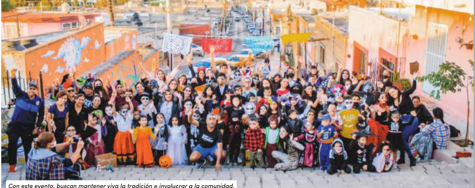
Con este evento, buscan mantener viva la tradición e involucrar a la comunidad.