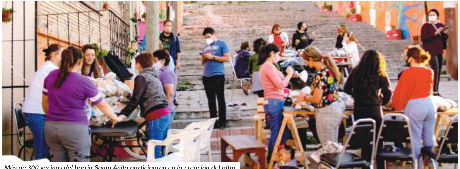
Más de 300 vecinos del barrio Santa Anita participaron en la creación del altar.

En este evento cultural hubo antojitos mexicanos, artesanías y música en vivo, se congregaron un aproximado de 55 mil visitantes que disfrutaron de diversas festividades que se realizaron en el marco del Día de Muertos.