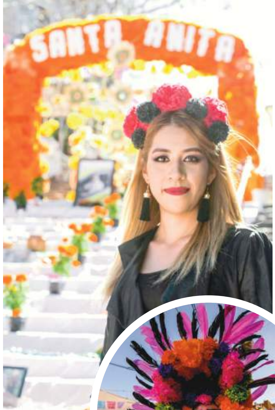
Visitantes al altar.